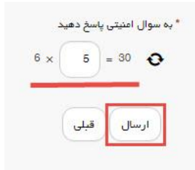
تصویر ۲۰- سوال امنیتی

در صورت خالی بودن فیلد های اجباری با پیغامی در بالای صفحه مواجه می شوید و سیستم از ثبت درخواست جلوگیری می کند. (تصویر ۲۱)