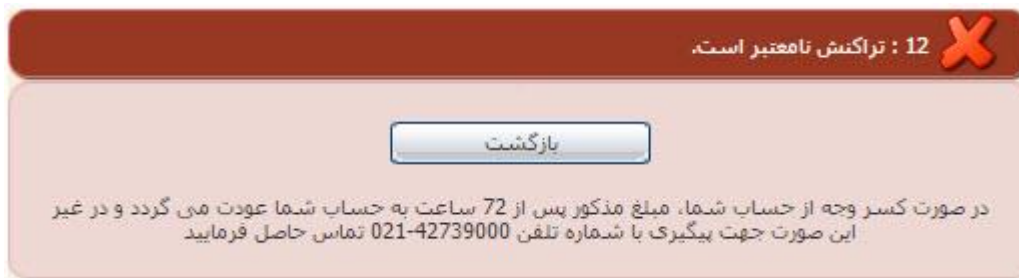
تصویر ۲۴-نمایش اخطار تراکنش ناموفق

در صورت ناموفق بودن تراکنش سیستم پیغام زیر را نمایش داده و امکان رفع مشکل و سعی مجدد را برایتان فراهم می نماید. (تصویر ۲۴)