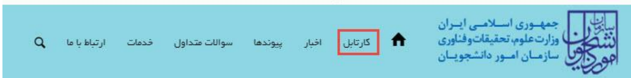
تصویر ۲۵-کارتابل شخصی

با دریافت پیغام جهت مراجعه به پورتال، برای مشاهده وضعیت خود اقدام نمایید. از طریق پورتال سازمان امور دانشجویان سربرگ کارتابل را انتخاب نمایید. (تصویر ۲۵)