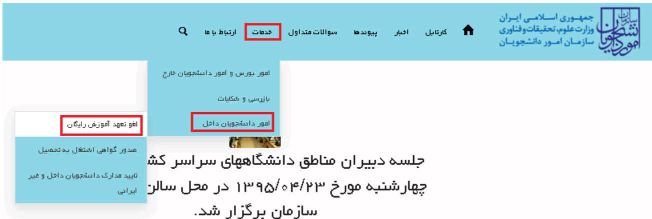
تصویر ۱-نمایش پورتال

از طریق پورتال سازمان امور دانشجویان و از سربرگ خدمات، بخش امور دانشجویان داخل را انتخاب کرده و سپس در این قسمت جهت ثبت درخواست بر روی لغو تعهد آموزش رایگان کلیک نمایید. (تصویر ۱)