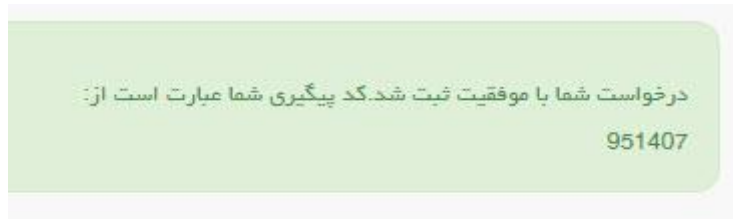
تصویر ۲۳- نمایش کد پیگیری

در صورت ناموفق بودن تراکنش سیستم پیغام زیر را نمایش داده و امکان رفع مشکل و سعی مجدد را برایتان فراهم می نماید. (تصویر ۲۴)